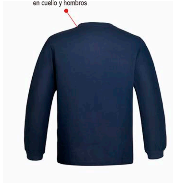
Costura reforzada en cuello y hombros