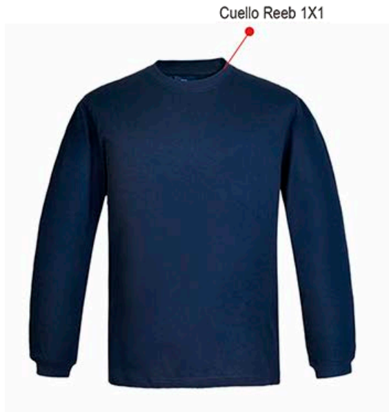
Cuello Reeb 1X1